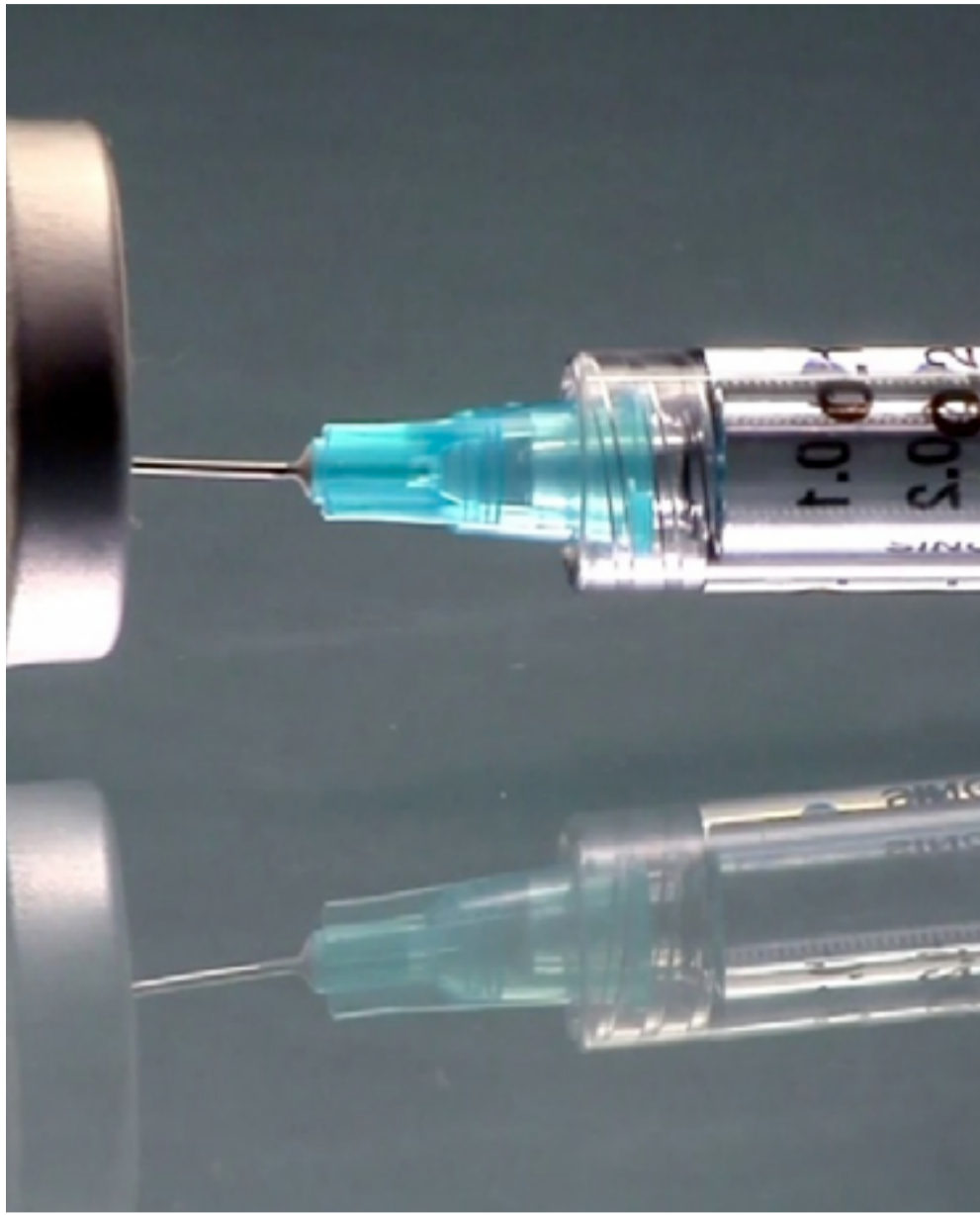
Les nouvelles formes de fraude : le dopage et le hacking. Une tendance qui tend à se développer au sein des grandes villes.

NOUS LE SAVONS, depuis le scandale Roché, qui brûle encore toute les lèvres, notre état de santé est déplorable. Nous devons constamment faire attention à ne pas tomber malade. Toujours d'après les sociologues, nous commençons à voir une société basée sur la peur de l'autre, la peur du contact humain. Nous courrons à la catastrophe et notre technologie ne pourra pas remplacer ce besoins fondamentalement humain : la socialisation. L'homme n'est pas fait pour se débrouiller seul.